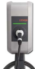
Webasto PURE 11 kW